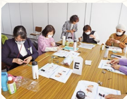
〈防災・手芸講習会〉

栗原 大変重要な役割を担っていただいております。この魅力ある活動をさらに広げていくために、JAに要望したいことや期待することがあれば、ぜひお聞かせください。