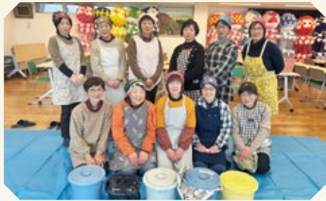
〈みそ作りをする蔵王支部員ら〉