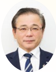
山形農業協同組合 代表理事組合長