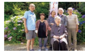
紫陽花ドライブツアー