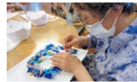
創作教室(布でリースづくり)