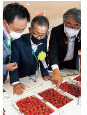
「佐藤錦」は今年で初結実から100年目を迎えました。

出品された「佐藤錦」と「紅秀峰」は品評会後に、山形市のやまぎん県民ホール内の特産品ショップ「0035 BY K IYOKAWAYA」で販売されました。