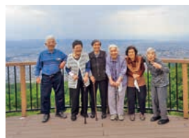
西蔵王ドライブツアー