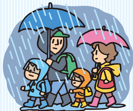
イラスト：服部新一郎

活発な積乱雲が線状に並ぶと、同じ場所に次々と雨雲がかかり、非常に激しい雨が数時間続き、記録的な大雨になる恐れがあります。線状に連なる雨雲により、3時間の雨量が150mm以上の所があり、災害の危険度が高まっているとき「顕著な大雨に関する情報」が出ます。このようなときは危険な場所からは直ちに避難する必要があります。