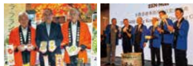
台湾の百貨店と販売協定締結 全農の香港事務所開設お披露目