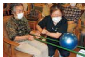
運動教室(ボール遊び)