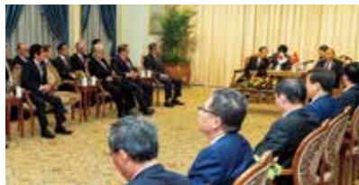
北京一帯一路国際会議