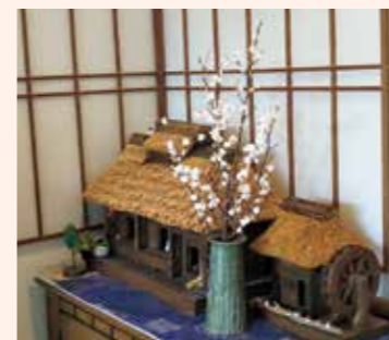
2021年5月家を持ち帰った

私は農家ではありませんが、毎年、妻が「啓翁桜(小)」を購入し、1月、2月と家の中で早めの桜を見て、心を和ませていました。3月になると花びらが落ちて廃棄するだけになってしまいます。緑の葉は残っているのでも「なんかかならないか」と思っていました。折り紙で花びらを作って貼ったら・・・と思い、今年は張りきってみましたので、その結果を販売元のおいしさ直売所南館店に連絡しようと考えました。昨年(写真2020年3月作成)は大きい花びらを数枚切って、花びらが無くなった枝に貼り付けて自宅で飾りました。ちょっと楽しんだだけ(自己満足)で終わりました。今年(写真2021年3月作成)は啓翁桜のはなびらと同じくらいの大きさに作ってみました。30枚くらいの花びらがあれば良いかと思い、枝に貼付けましたが桜に見えない事がわかりその後は必死に追加しました。大変でした。3月3日の雛人形の後にこの偽物啓翁桜を4月一杯、職場に飾りました。花瓶に水を入れてまだ緑の葉も付いていたので職場ではかなり好評でした。この花は「山形県の啓翁桜」と言って冬に咲く桜、ということを宣伝しました。さすがに4月になると緑の葉も無くなり5月に持ち帰りました。写真「2021年5月家を持ち帰った」水の入っていない花瓶に入れてある状態になりました。※50cmくらいの枝に貼付けました。写っている民家は模型です。本来、啓翁桜を 折り紙を貼り付けて啓翁桜にすることは、生産者さんから怒られるかもしれませんが、お許しください。ただ、啓翁桜が綺麗なため、生産者の方々にお礼という気持ちも込めてお送りいたしました。生産者の皆様にお伝えして頂ければ幸いです。(一部抜粋)