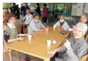
ドライブツアー(野草園)