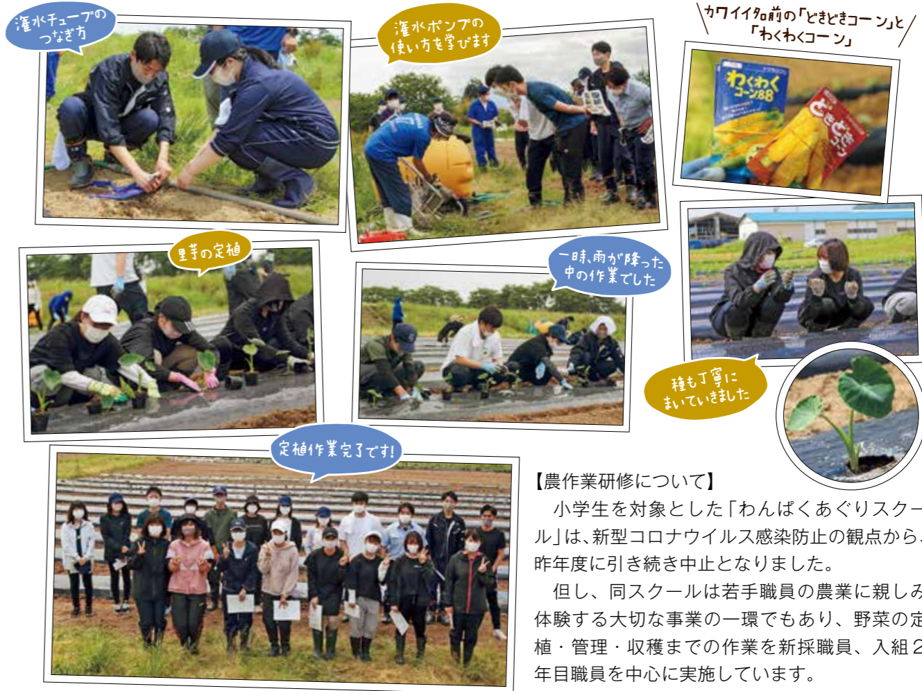
灌水チューブのつなぎ方