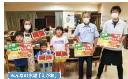
みんなの広場「えがお」