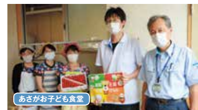
あさがお子ども食堂