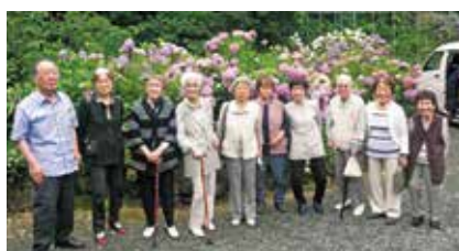
ドライブツアー(紫陽花)