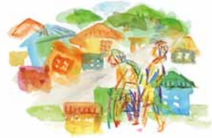
illustration : Kikuchi Toshiaki

先日、10代でロシアからドイツに移り住んだ女性が、60年ぶりに生まれ故郷を訪ねるといふドキュメンタリー映画を観た。1930年代、スターリンの粛正で父親は収容所に送られ、10年後に病気になるまで帰還。父親の死後ロシアに見切りをつけて母親と二人で頼る人もいないドイツに移住した。そこで結婚して二人の子供をもうけ、今や子供や孫たちが休日集まるゴッドおばあちゃんだ。 さて故郷ロシア（キエフ）への旅に同行したのは孫娘の一人。生家を探し、隣人の消息を聞いて回り、父親のお墓を訪ねる。老いて背中曲がった彼女は、雪深く凍結する道路を孫娘に抱えられながら歩き回る。深く刻まれた顔と手の皺のクローブアップが、彼女の苦難の人生を思わせる。故郷を捨てて根無し草のように生きなければならなかったこの老女の気持ちを想像してみた。どんな思いで60年間生きてきたのだろうか。観ている間中、映画の中の老女と私の母がオーバーラップした。 5年前、叔父の法事のため母の生まれ故郷の新発田市を訪れた。法事の翌日母は突然、生家はもうないけれど付近を散策してみたいと言いつつ出た。母の生家は新発田駅前前の諏訪神社近くにあり、商店街の活気ある界隈だったらしい。いつでも行けたはずなのに、なぜか母はもう何十年もそこを訪ねていなかった。諏訪神社にお詣りした後、母は生家の跡を熱心に探し始めた。映画の中の老女のように背中が丸くなった身体を私に抱えられながら懐かしそうに歩き回った。 昭和24年、母は親に決められた相手と結婚式をあげるため、米坂線で新発田から米沢駅に降り立った。トンネルを抜けるたびに薄暗く寂しくなる風景を見て次第に心細くなり、自分の家族が帰った後は毎日泣きな