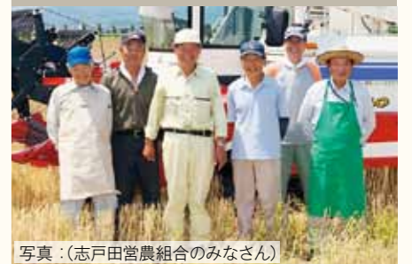
写真：(志戸田営農組合のみなさん)