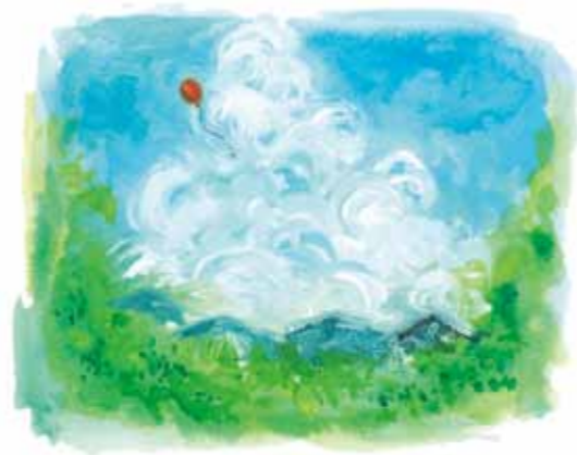
illustration : Kikuchi Toshiaki

「さあ、完了、出発だ！」 「あれ？」 ガス風船は、中空を漂うばかりであった。葉書と紙一枚だけでも重いのだ。 改めて、郵便局に走り、葉書と同じ額の切手を一枚買い、急いでもどった。ノートの切り端に、細かい字で書き、わずかな余白を残した。切手の糊をなめた。 「さあ、ふくつの精神、再びの挑戦です！」 その時である。一匹の、やや大きめのクロアリアが、ヒマワリの太い茎を登っていくのが見えた。一瞬、出発の手が止まった。 ケンは、紙をくしゃくしゃにもんで柔らかくして、小さな小さなかごを作った。ケン以外だれもしらない。飛行士クロアリア一匹の、ガス風船実験飛行であった。「手を離すぞ！」