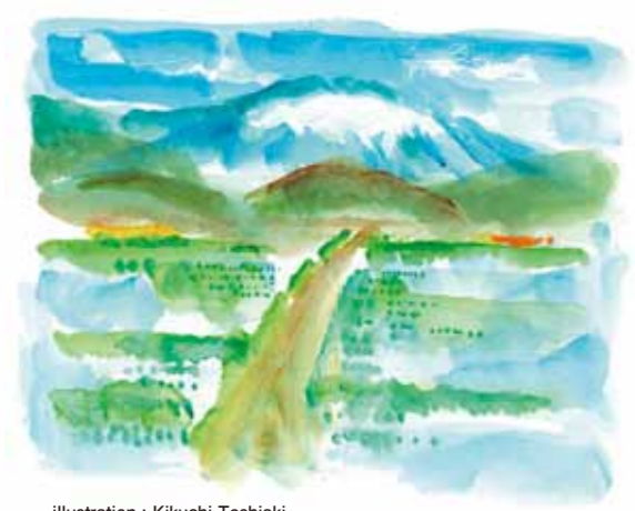
illustration : Kikuchi Toshiaki