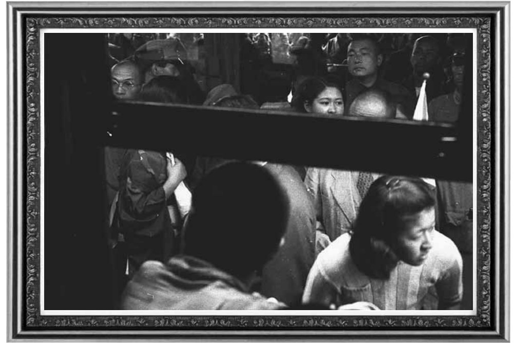
昭和17・8年頃上山駅のホーム（量三と共に車窓出征）（蟹仙洞 美術館所蔵）