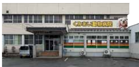
くみあい動物病院（山形県食肉公社向） 山形市船町1030-1 TEL.684-1403