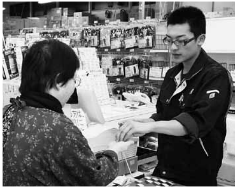
お客様とのちょっとした会話も大切にしています。