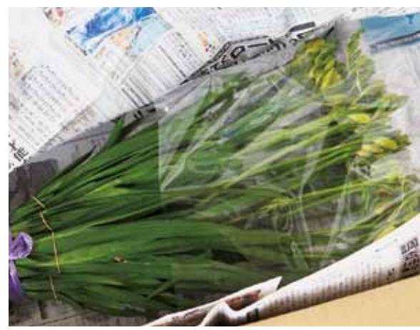
市場で高評価を得るには、茎の長さ、花の形など細部にまで気を遣う必要があります。

イクルを早めて栽培する方法ですが、我々の場合はその栽培時期をかなり早めているので超促成栽培と呼んでいます。具体的には、8月上旬に球根を農協の大型冷蔵庫に入れてもらい、50〜60日ほど冷蔵して冬を体験させます。それを9月下旬〜10月上旬に、ビニールハウス内に定植して、あとは