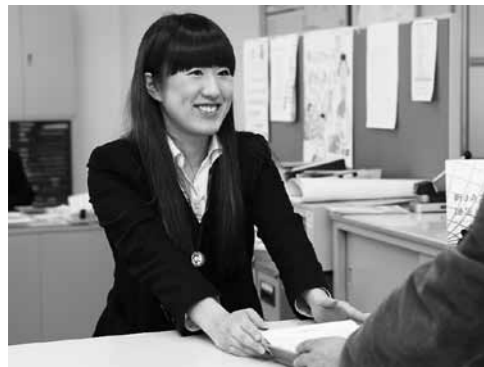
元気なあいさつと笑顔を心がけています。