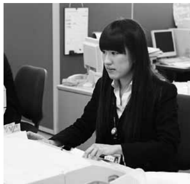
端末操作もずいぶん慣れてきました。

●入組からもう10ヶ月程が経ちましたが、仕事にも職場にも慣れましたが、仕事の方では時々不安になることもあったりして、まだ先輩方に教えていただいたり、確認しながらという感じです。窓口では担当する仕