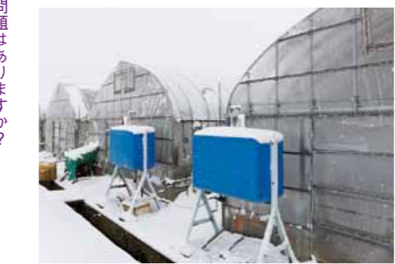
ハウス内は灯油を燃やして温度管理。毎日の天候・気温には気を遣います。

— 他に競合するところはないのですか？ 皆さん 超促成栽培は茨城県でやっているくらいで、そういう意味では競合相手は少ないです。ただ昔と違っていまは、冬でもいろいろな花が栽培されるようになりまして、他の花に負けられないように品質のいい花を生産して、消費者の皆さんに選んでもらえるようにしないとけないと思っています。 — お話を伺っていると、競合相手も少なく、安定した経営ができていている感じですが、