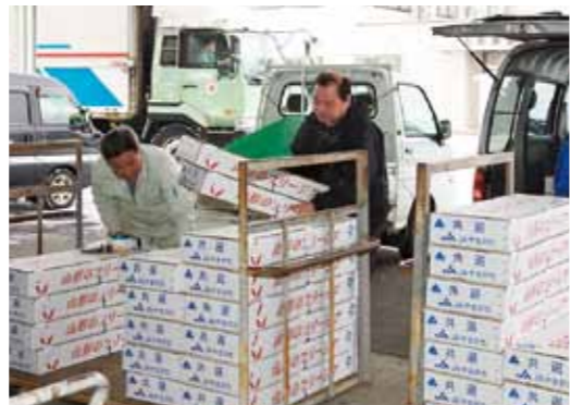
自宅で選別してきた花を箱詰めし、毎朝中央営農センターに出荷します。

日々、温度管理や水管理しながら栽培して、11月20日ころから出荷が始まるというサイクルです。普通栽培のフリージアは10月ころに定植します。 — 花でもいろいろあると思いますか？ それももちろんです。フリージア栽培を始めたのですか？ 皆さん フリージア栽培をしている農家は野菜農家が多く、食用菊やトマト栽培をしている人が多いのですが、そうした作物の後作として何かいいものはないかと探していた時に、ちょうど寒河江の園芸試験場でフリージアの超促成栽培を研究していたんです。それを見学する機会がありまして、フリージアの促成栽培なら食用菊やトマトの後作にいいし、花の少ない冬期間の出荷になり、価格も期待できるということでフリージア栽培が始まったのです。