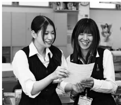
上司・先輩にご指導いただき、早く一人前になれるようがんばります。

●焦らなくても、一歩一歩がんばって行けば、大丈夫だと思いますよ。 館石 はい、私もやるべきことを一つずつ確実に、しっかりとやっていきたいと思っています。がんばりますのでこれからもご指導の程、よろしくお願いたします。