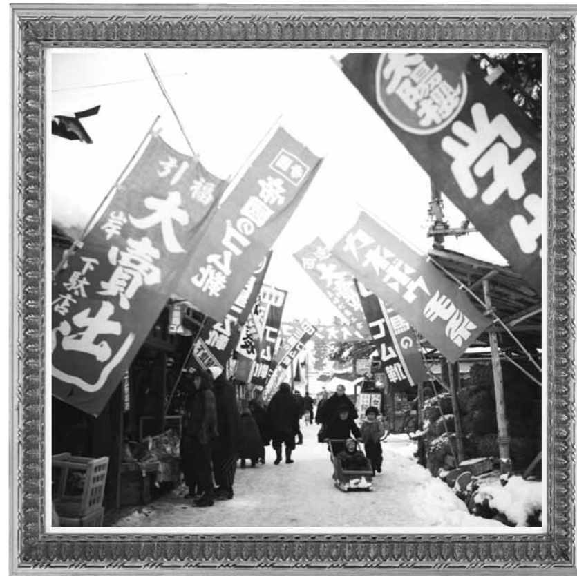
昭和29年12月 中山町・元町 年末年始連合大売出し

県立上山明新館高等学校、県立米沢女子短期大学(国語国文科)卒業。今年度JAやまがたに新規採用となり、東金井支店の金融共済課に配属となる。中学～短大までずっとバドミントン部で、現在もJAやまがたのバドミントン部に所属。その一方、学生時代から旅行も好きになり、休みを利用して友人と国内旅行を楽しんでいる。山形市在住、20歳。