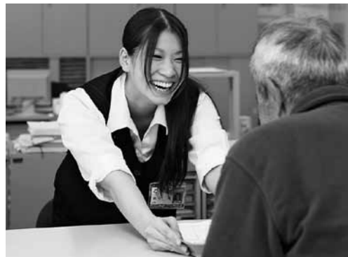
いつも明るい笑顔で心をかけています。