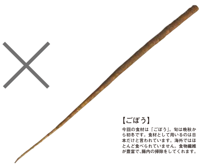
【ごぼう】 今回の食材は「ごぼう」。旬は晩秋から初冬です。食材として用いるのは日本だけと言われています。海外ではほとんど食べられていません。食物繊維が豊富で、腸内の掃除をしてくれます。