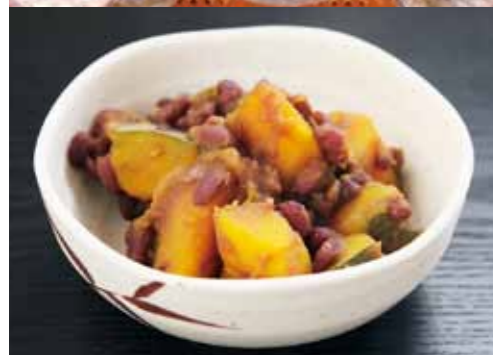
独特な形の「蔵王かぼちゃ」。皮がとともかたく切るのが大変ですが、とてもおいしいかぼちゃです。ぜひ一度、おためし下さい！