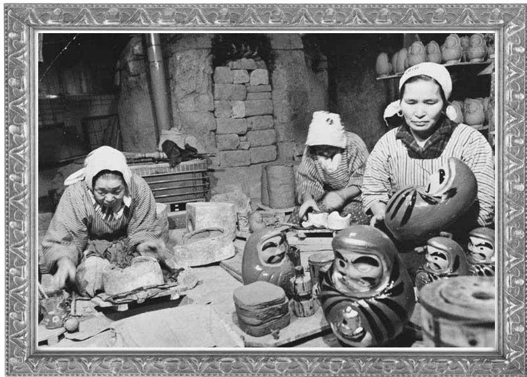
昭和46年 だるま製作 大字平清水 齋藤家 (山形市郷土資料収蔵所)

組合員の皆様と、早く親しい関係を築ければと思います。今後とも、どうぞよろしく願っています。