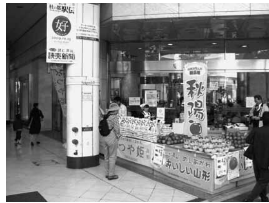
10月11日・12日 仙台 つや姫PR

10月11日・12日の2日間、仙台のデパート前で、山形の米「つや姫」のPR販売が行われました。今回は全農山形とJAやまがたが共同でPR活動を行いました。デパートの開店時間と同じ時間に販売を開始し、2日間で450袋（1袋2kg）のつや姫を準備しましたが、両日とも販売開始から数時間で売り切れるほどの盛況ぶりでした。