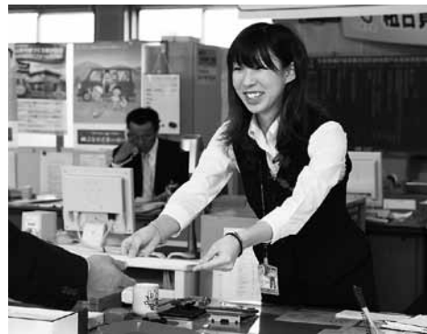
お客様には笑顔で応対することを心がけています。