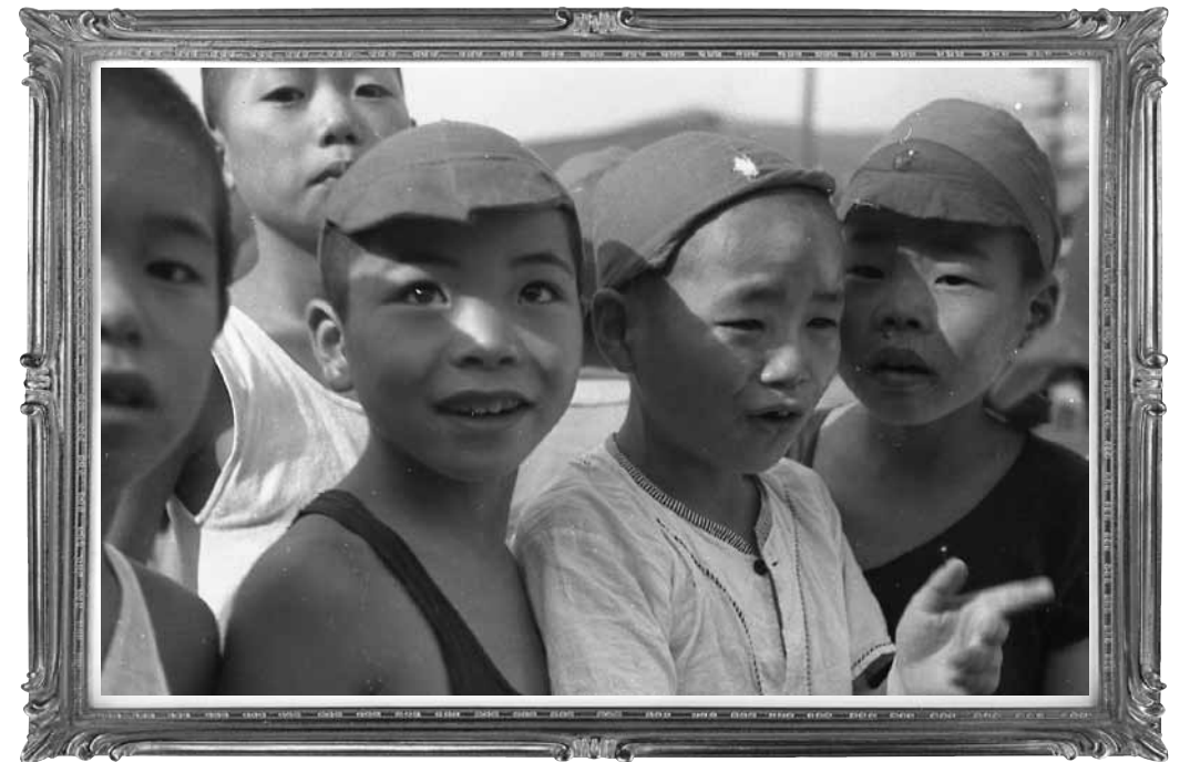
昭和20年代の上山小学校の運動会より 赤組の男子生徒等