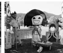
南部営農センター