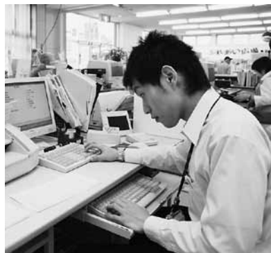
どんな仕事でもそうですが、端末操作は特にミスのないように注意してやっています。初心忘るべからず!