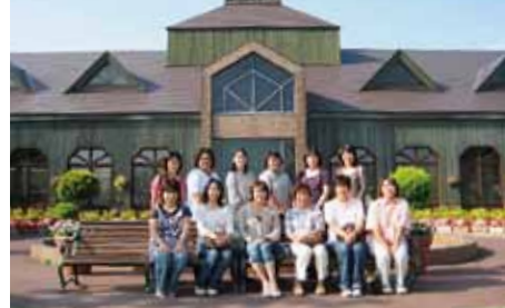
フレッシュミズ部では、毎年親子夏休み工作教室や1日研修旅行を行っています。

を超えて料理の作り方を教え合ったり、いろいろな話を聞くなどの交流がもてます。それはすごく勉強になることです。そんな機会はなかなかないのではないのでしょうか。また支部内の人たちとは特にお付き合いが深まりますので、日常的にも何かあれば協力してくれたり助けてくれたりと結びつきが強くなります。そういう部分もすくなくいいところだと私は思います。