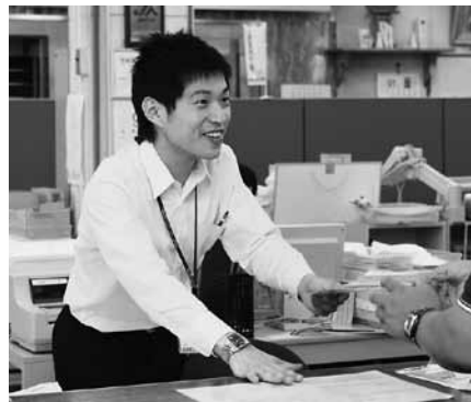
入組から半年が経って組合員さんのお顔もだいぶ覚え、窓口でも自然な笑顔で対応できるようになりました。