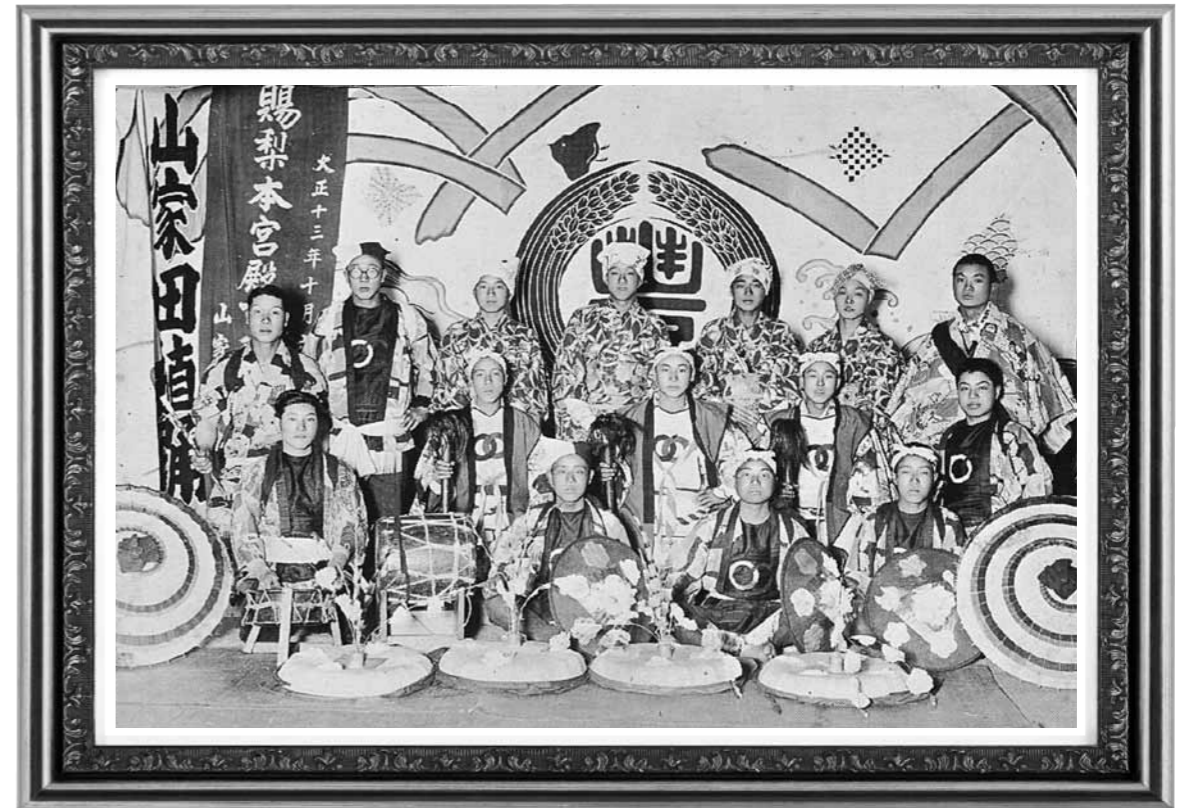
昭和12年頃 山家田植踊連中 山形市郷土資料収蔵所（山形市郷土資料収蔵所）