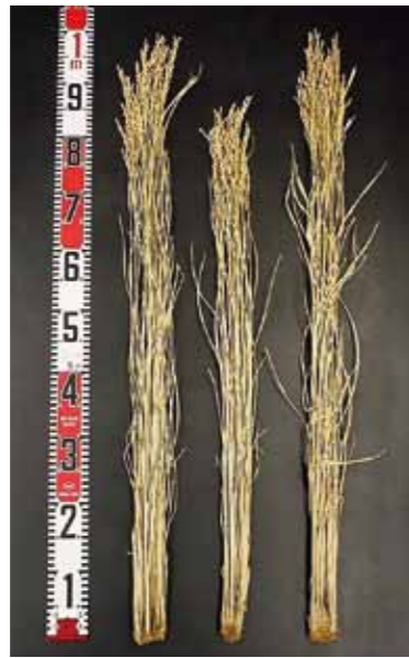
左がこゆきもちで、中がヒメノモチ、右がでわのもち。