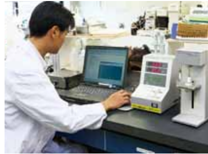
餅の固さや粘りを測定しています。