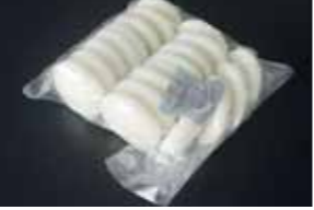
「こゆきもち」は生餅で食べても美味しいが、大福餅や切り餅、丸餅などに加工してもその良さが生きるということです。