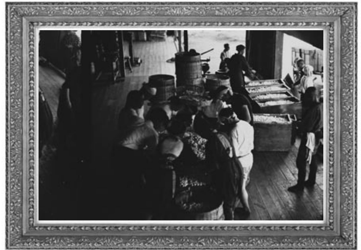
昭和9年頃 春蚕の繭の入荷・荷受風景(上山長谷川製糸所)(蟹仙洞 美術博物館所蔵)

山形北高等学校、東北福祉大学(総合福祉学部 社会福祉学科)卒業。今年度JAやまがたに新規採用となり、滝山支店の金融共済課に配属となる。高校時代はなぎなた部に所属。大学に進んだからは旅行が趣味で、現在も時間がとれば旅行に出かけたこと。山形市在住、22歳。