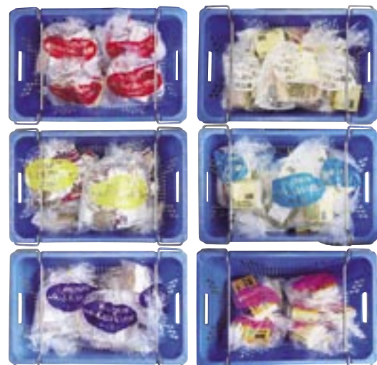
「JAふれあい食材」は6コースあり、写真のように色違いの袋に入れてお届けしています。

ね。朝のパッキングから出発までの作業を拝見していましたが、皆さんすごく忙しいように動かれていた理由がわかりました。 岡崎 そうですね、配達が遅くなればご契約いただいている皆さまにご迷惑をお掛けするケースも出てきますので、朝の時間帯は本当に忙しいです。その日の道路状況によっては何かあるかわかりませんが、やはり早く出発したいという気持ちがありますからね。 — では次に「JAふれあい食材」について紹介していただきたいのですが、食材はどのような内容になっているのですか？