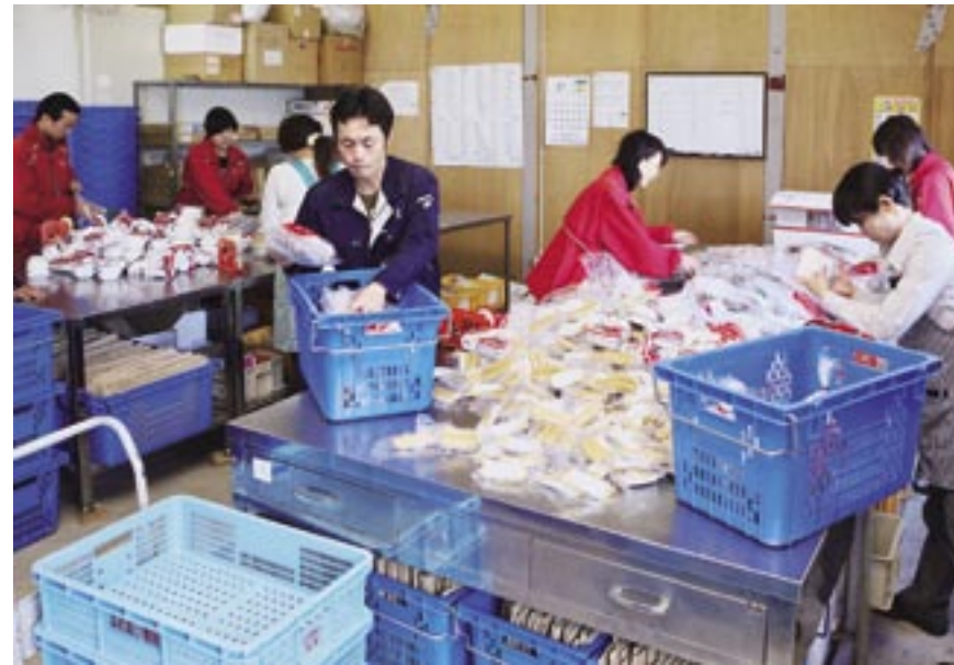
食材の仕分け作業は、食材センターで働くメンバー総出で一気にいきます。いろいろな話題で情報交換しながらも、手は一時も休むことなく動き続けます。

内容については、魚主体コースや肉主体コース、おひとりコースについては特に説明は不要と思いますが、「かがやきコース」は充実した食材が入っているちよっと贅沢な内容で、「らくらくコース」は忙しい人向けの調理が簡単な内容となっています。利用者の多い基本コースは、魚や肉などバランスのとれた食材