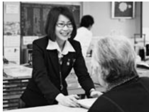
お客様、組合員様のお名前やお顔はまだ覚え切れていませんが、笑顔だけは忘れないようにと頑張っています！