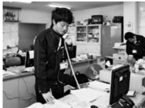
普段は広域配送センターの事務室で仕事をしています。電話対応にもなんとか慣れました！