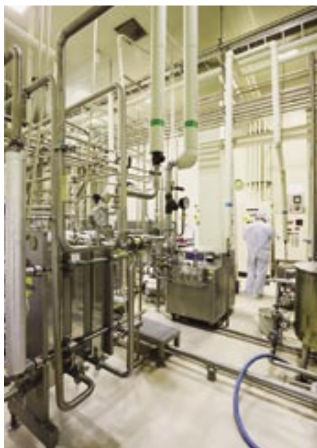
金属のパイプが縦横に走る殺菌室。この部屋で生乳が殺菌処理されます。

後藤 検査に合格したらいったん工場内のタンクに入れられ、その後「殺菌室」に送られます。そして実際に係員が風味検査を行います。異常のないことを確認してから殺菌処理を