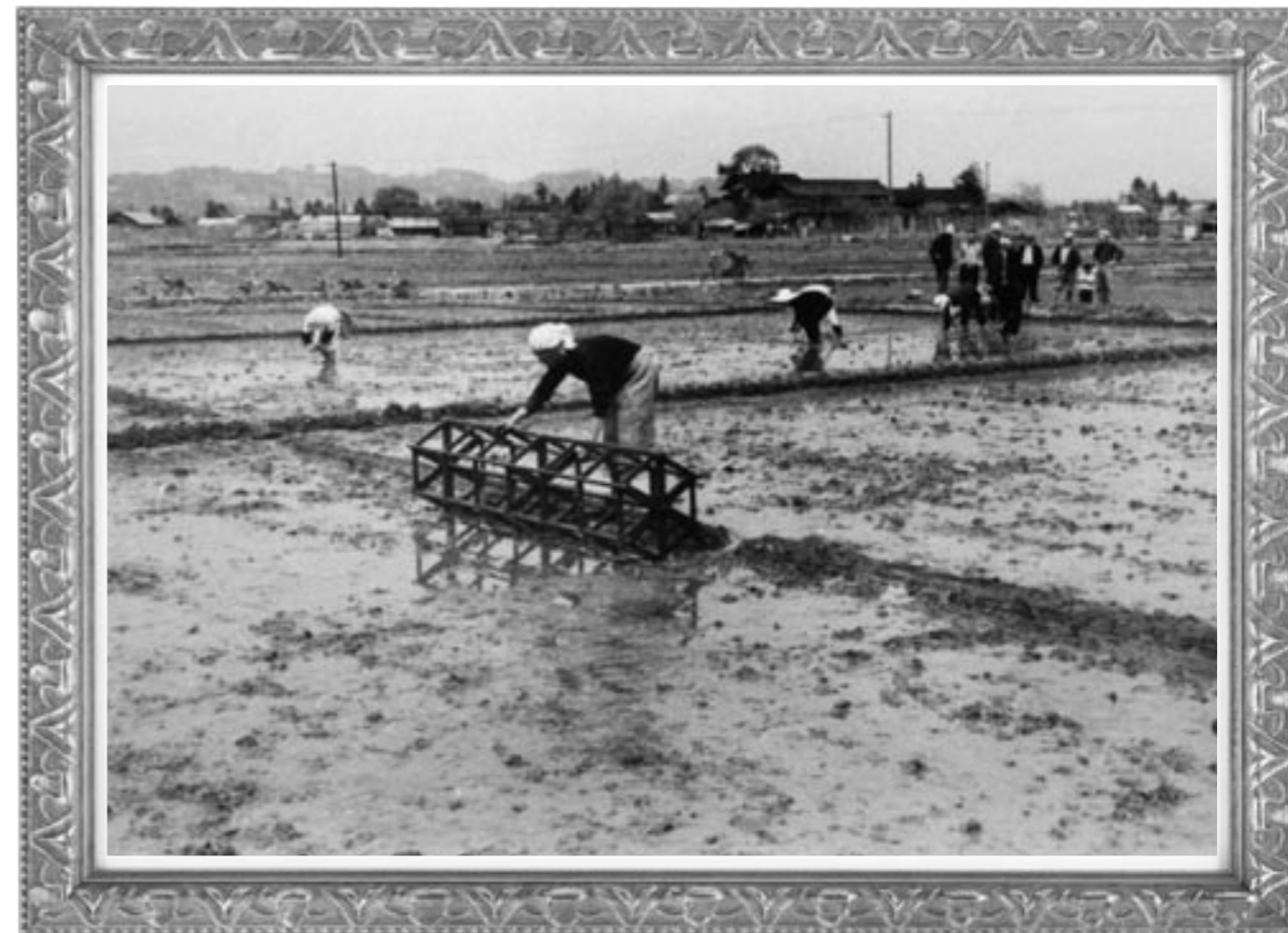
昭和34年 中山町・田植え風景 広瀬付近