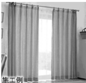
施工例 窓にぴったりのオーダーカーテン 片開き1枚or両開き2枚 巾~200cm

JAがオーダーカーテンをはじめました。 オーダーカーテン1窓 1万円 巾200×丈220cm以内 (税込 10,500円)