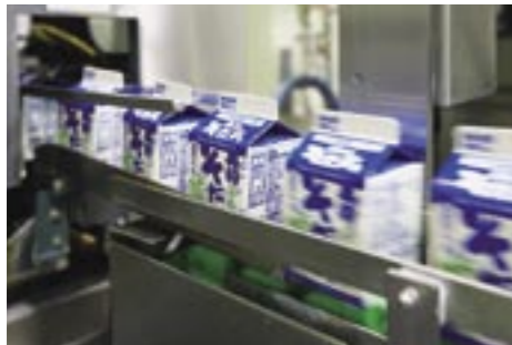
牛乳大型パックの生産能力は1時間に5500本。

行います。通常は130℃で2秒の殺菌です。この後はまたいったんタンクに入れられますが、時間を置かず「充填室」に送られて容器に詰められ、そのままベルトコンベアで「ケーサー室」に送られてケース詰めされ、そして冷蔵庫へ入れられます。この殺菌からケーサー室に至る工程にはまったく人は関わらず、すべて自動化されています。これは特に人件費削減のためということではなく、製造工程にできるだけ人が関わらないようにすることで、人為的なミスや汚染などがないようにするためです。