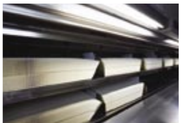
国内でここだけという、紙パックをオゾンで殺菌する設備。

行います。通常は130℃で2秒の殺菌です。この後はまたいったんタンクに入れられますが、時間を置かず「充填室」に送られて容器に詰められ、そのままベルトコンベアで「ケーサー室」に送られてケース詰めされ、そして冷蔵庫へ入れられます。この殺菌からケーサー室に至る工程にはまったく人は関わらず、すべて自動化されています。これは特に人件費削減のためということではなく、製造工程にできるだけ人が関わらないようにすることで、人為的なミスや汚染などがないようにするためです。