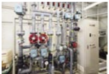
水処理室では、汲み上げた地下水を国内最高レベルまで衛生処理します。