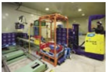
できあがった製品がケーサー室まで自動的に運ばれてきます。