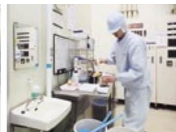
生乳の受け入れ前に6項目を検査します。

だわり牛乳”などがあります。また容量もいろいろありますので、細かく数えると計6アイテムになります。生産能力は1日に30トンになります。