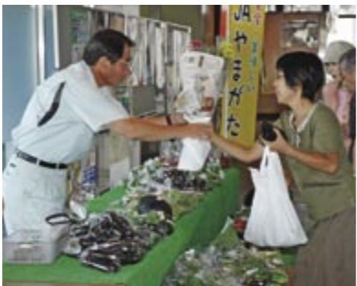
毎月第2・4水曜日に県庁でも直売所をオープンしています。職員の方のみならず、近所にお住まいの方も買い物にいらっしゃいます。