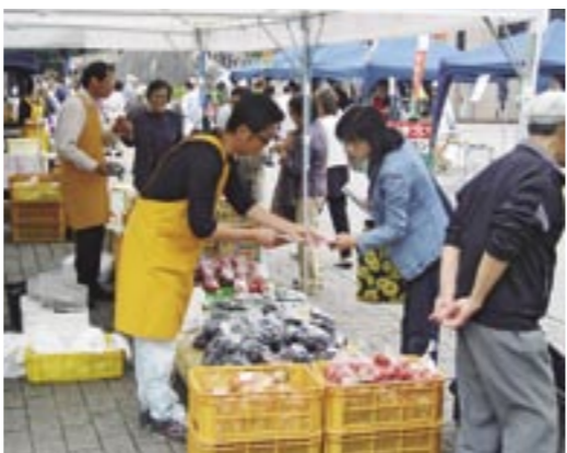
仙台勾当台公園で毎月(5～10月まで)第1・3水曜日に山形ふれあいマーケットが開催されます。当JAでも直売所をオープンしています。

にお客さんが増えていく。当店は広告宣伝は一切やっていないのに売り上げが伸びているのは、いま申し上げたことが大きいと思います。