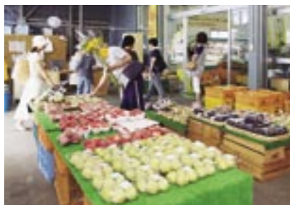
店内入口のエントランスにもたくさん品物が並びます(南館店)