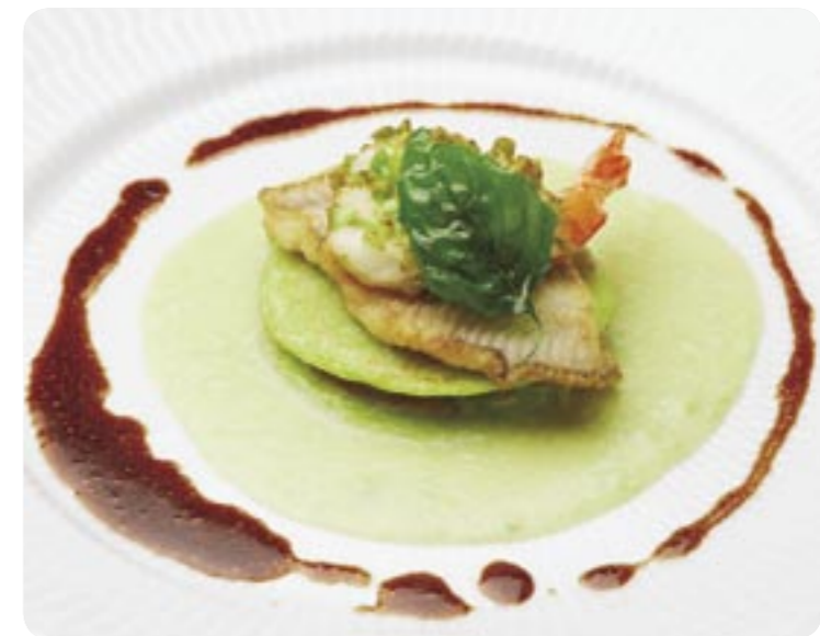
【白身魚と枝豆のプリニのミルフィーユ仕立て】 (枝豆とバルサミコソース添え)