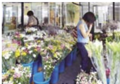
南館店では花の品揃えも豊富です