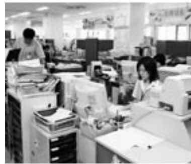
契約申込書の内容をパソコン入力。間違いがあってはいけない仕事なので神経を使います。