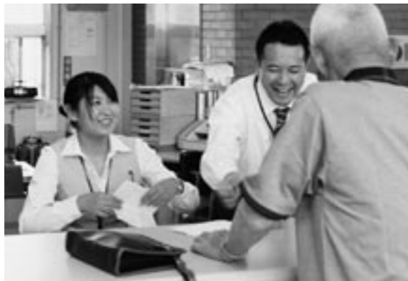
地域の皆様との会話があり、笑顔いっぱいの職場が大好きです。