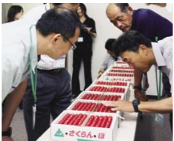
専門家の厳しい目で、厳正な審査がなされます。

—— 審査の現場には関係者やマスコミの他に、一般の方も入るのですか？ 鈴木 そうですね、まったく一般の方というのはいないと思いますが、さくらんぼ農家の方は自由に入れます。私達としても農家の方に見学していただくことは大歓迎で、忙しい時期とは思いますが、ぜひ一度、品評会に足を運んでいただければと思います。