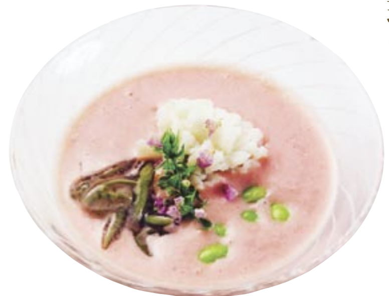
【トマトのすり流し椀】

●プロの調理人に「山形の旬の食材」を使ってオリジナル料理を作ってもらった企画です。この紙面で発表された料理は、お店のメニューに加わる事もあります。ご期待ください。