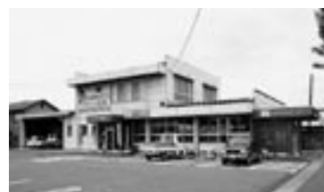
南館支店 金融共済課

山形城北高等学校、県立米沢短期大学(国語国文学科)卒業。今年度、JAやまがたに新規採用となり、4月から南館支店金融共済課に配属となる。20歳。山形市在住。