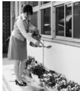
花への水やりも新人の大切な仕事。きれいな花で、皆さん和んでくださいね!