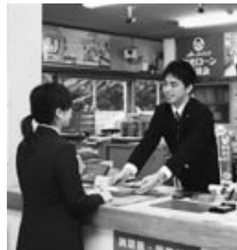
金融共済課の窓口担当ですので、たくさんのお客様に1日も早く名前を覚えていただきたいと思っています。