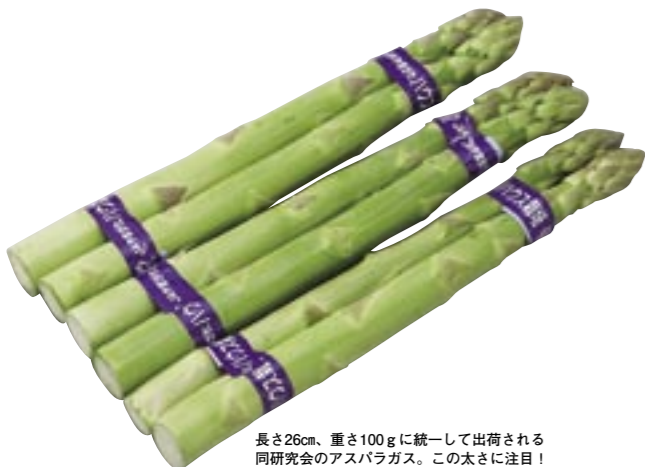
長さ26cm、重さ100gに統一して出荷される同研究会のアスパラガス。この太さに注目！

井上 この研究会のアスパラガスは「朝採り」が決まりになっていまして、たとえば今日の朝に収穫したものは、翌日にはスーパーの野菜売り場に並んでいます。ですから鮮度は抜群なわけで、消費者の評価は