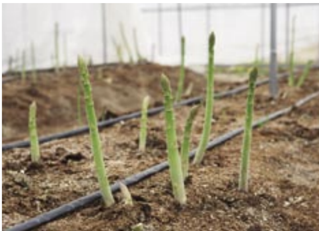
1日に5〜6cm伸びるアスパラガス。春採りは3月上旬〜5月上旬が収穫期で、夏秋採りは6月中旬〜9月に収穫します。