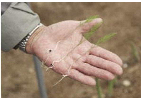
写真のような苗を植えると、3年目から10〜15年も収穫できます。

上々という感じですね。あとアスパラガスは、店頭で並んであるのを買って食べると、根本の方は固くて食べられないということがたまにあるかと思いますが、私たちのアスパラガスではそういうのはまずありません。といいますのは、私たちのアスパラガスは26cmという長さで統一して出荷していますが、その26cmに揃えるのに30cm以上に成長したものを収穫し、そして根本を4〜5cmも切って出荷しているんです。また肝心の食味も、他産地のアスパラガスに比べ甘味があるという評価をいただいています。