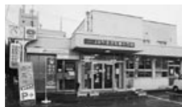
鈴川支店 金融共済課