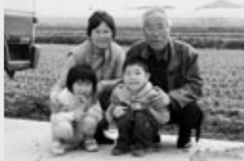
山形市大字前明石