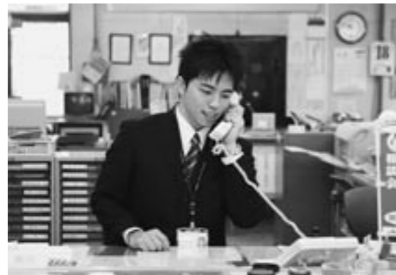
慣れない電話の対応ですが、元気にハッキリ心をかけています。

いか、気持ちの通い合う仕事をしたいと思ってました。そんな時、地域とグッドコミュニケーションというJAやまがたのキャッチフレーズが目について、ここならと思いましたが、自分が学んできたことを生かしながら、組合員の皆さんやJAを利用して下さる皆さんと、気持ちの通い合う仕事をしたいと思っています。一生懸命やっていますので、どうぞよろしくお願いいたします。