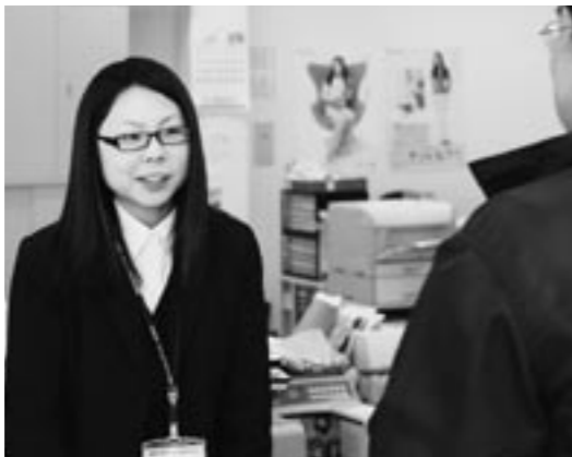
最初はお客様の対応も緊張しましたが、いまは落ち着いてできるようになりました。