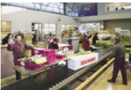
セリにかけられる花はベルトコンベアに乗せられ、次々と流れていきます。