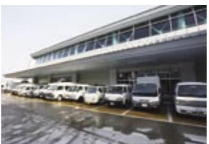
市場外にずらりと並ぶ買参人の方々の車。帰りは花がいっぱいに積まれます。

ネット活用の時代になっているのですね。ところで、当JA管内でもたくさんの方が栽培されていて、こちらの市場に出させていたいただいているわけですが、山形の花の評価はいかがですか？