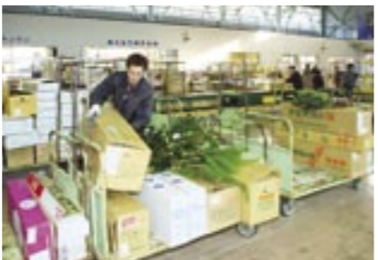
セリ落とされた花は、買参人ごとに台車に乗せ、分別されます。