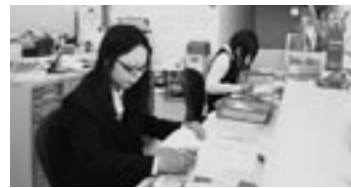
お金を扱う仕事なので、ミスのないようがんばります。