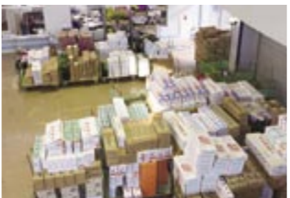
県内及び全国各地、世界各国から箱詰めされた花が届き、セリにかけられます。