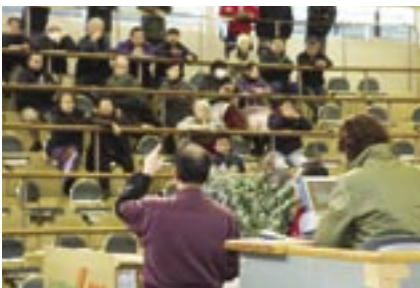
セリは手でのサインと口頭でのやりとりで行われます。