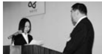
昨年の新採職員辞令交付式では、決意表明の大役を果たしました。